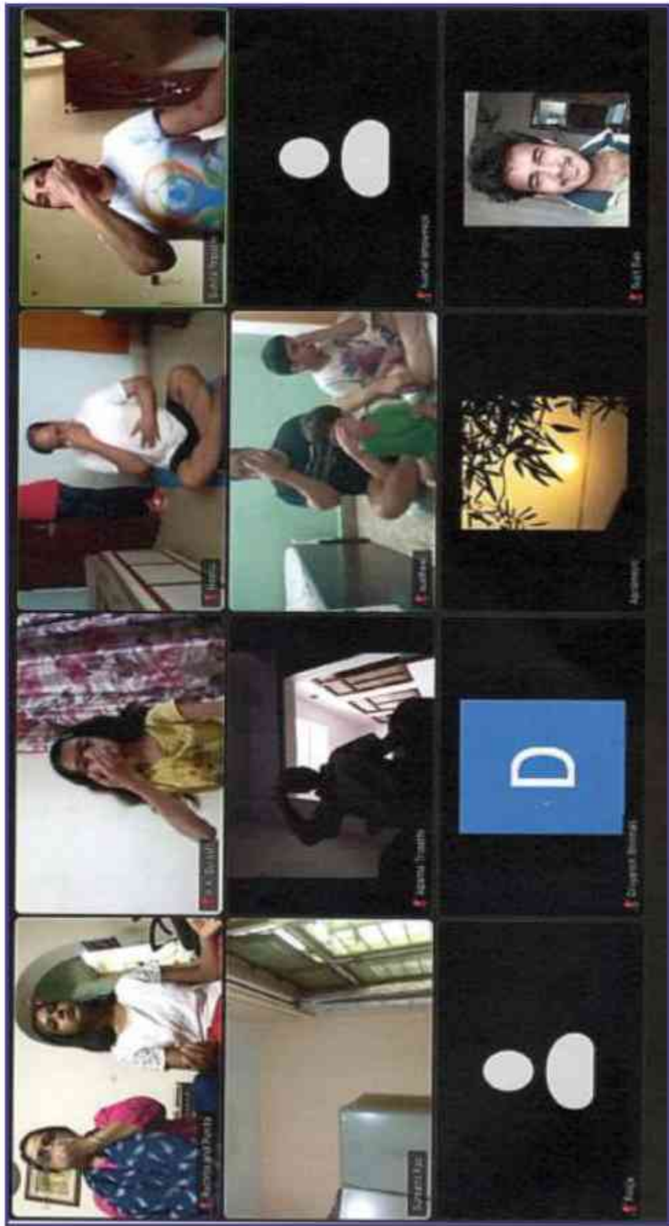
संस्थान में दिनांक 21 जून, 2021 को विश्व योग दिवस के अवसर पर ऑनलाइन माध्यम से योग कार्यक्रम का आयोजन। Online Yoga Day Programme in the institute on 21 st June, 2021 on the occasion of World Yoga Day.