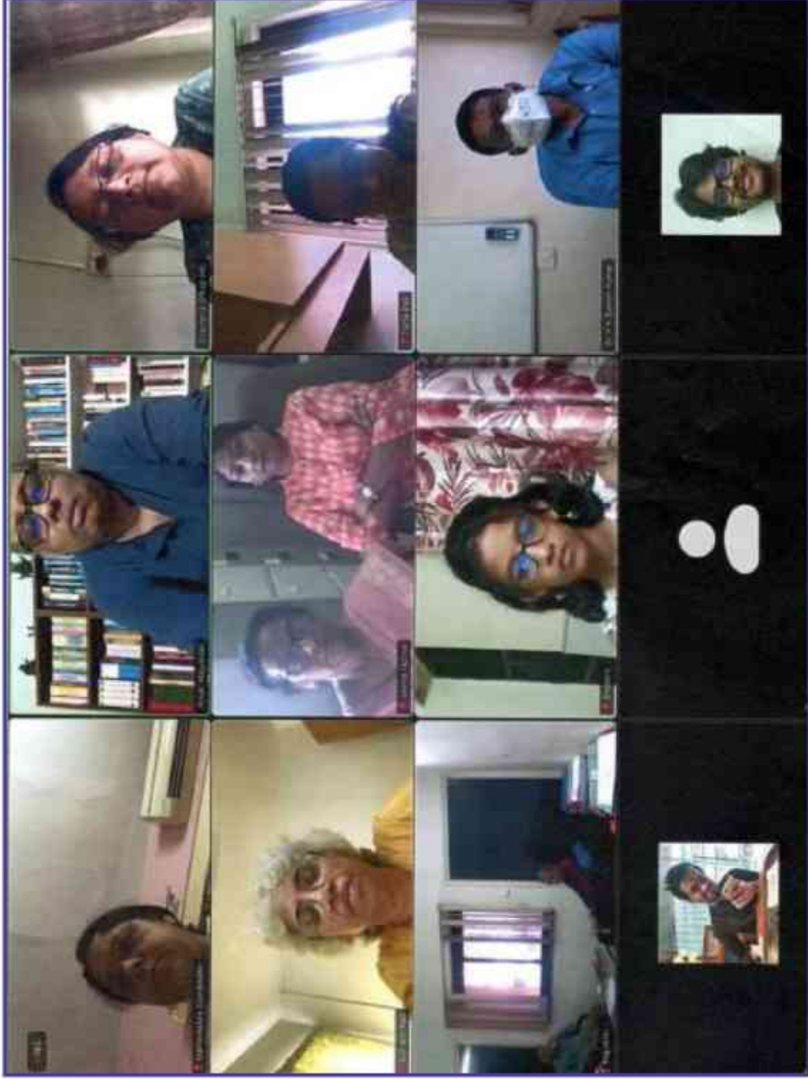
संस्थान में दिनांक 08 मार्च, 2022 को अन्तर्राष्ट्रीय महिला दिवस के अवसर पर ऑनलाइन माध्यम से आयोजित कार्यक्रम। An online programme organized on 8 th March, 2022 in the Institute on the occasion of International Women's Day.