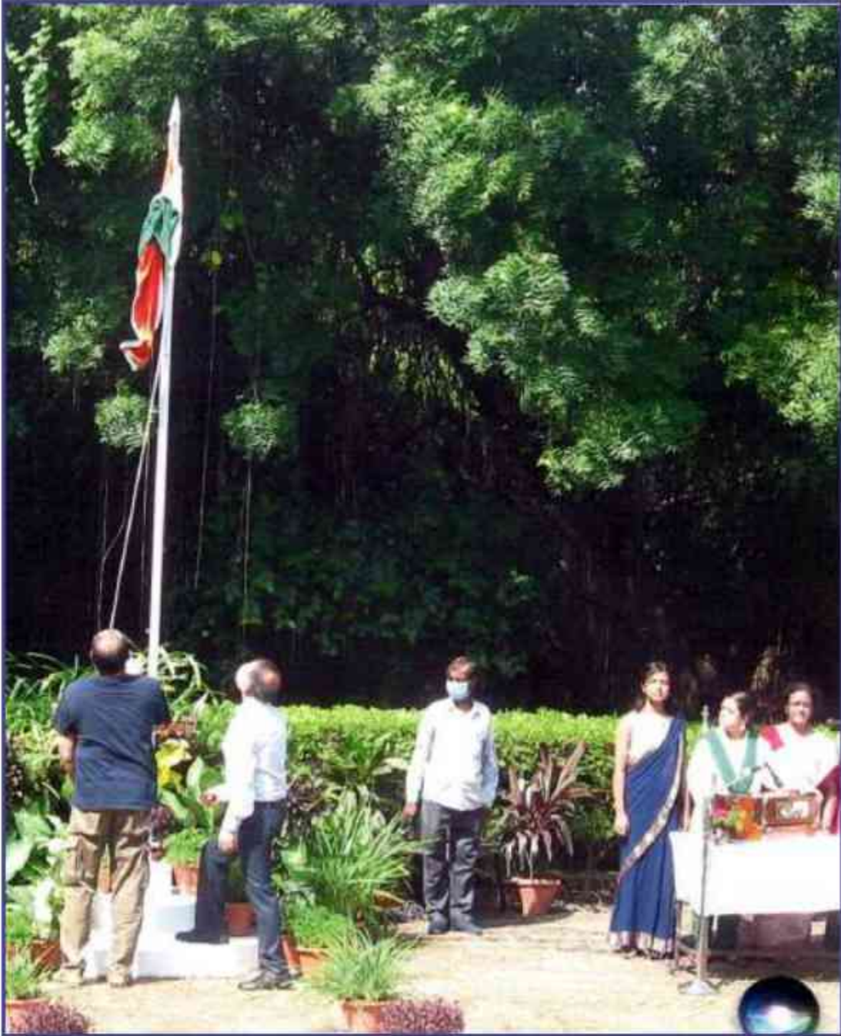
संस्थान में स्वतंत्रता दिवस 2021 के अवसर पर ध्वजारोहण कार्यक्रम का आयोजन। Flag Hoisting Programme in the Institute on the occasion of Independence Day 2021.