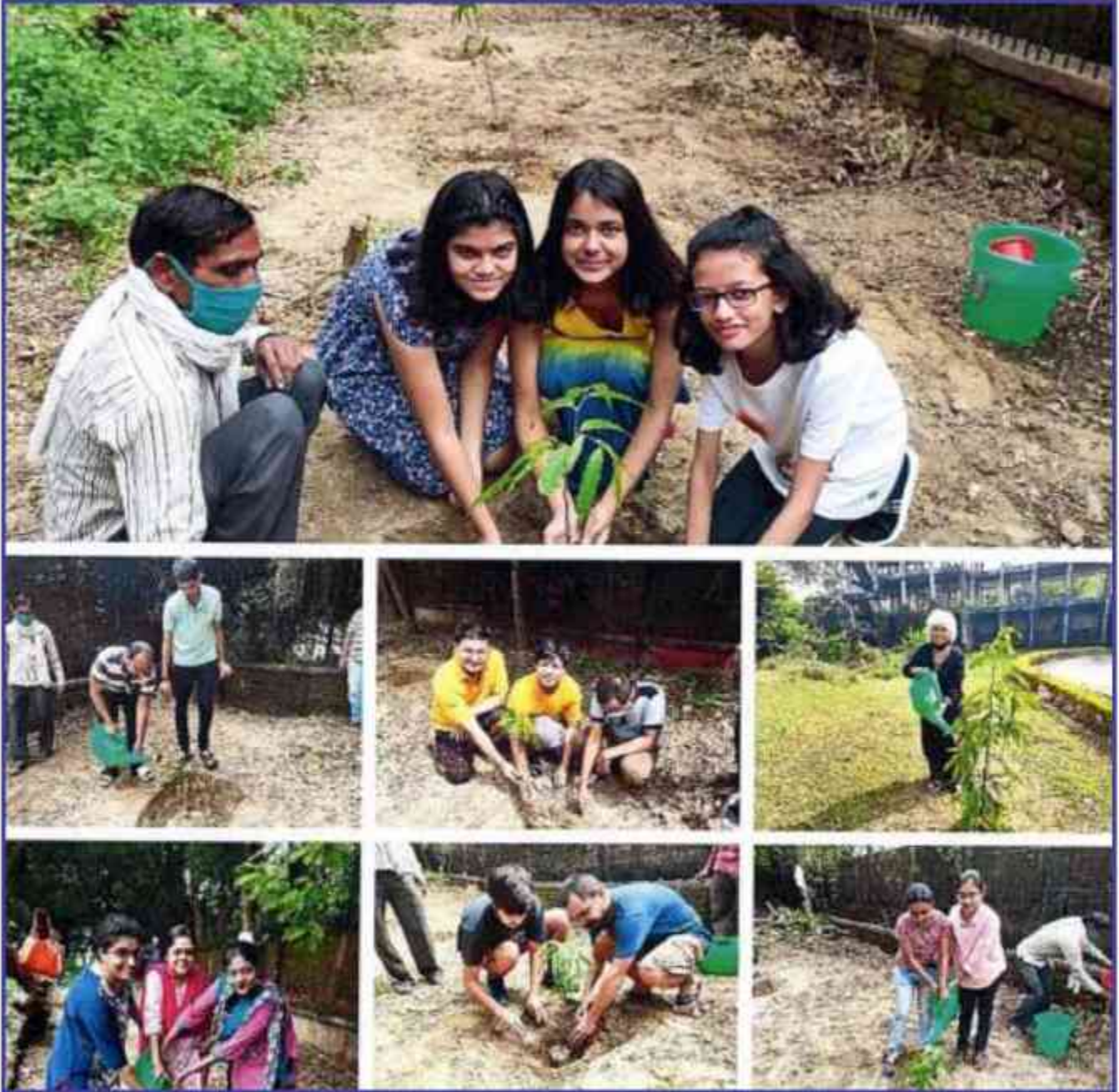
संस्थान में दिनांक 02 अक्टूबर, 2021 को गांधी जयंती के अवसर पर सदस्यों द्वारा पौधारोपण। Tree plantation in the institute on 2 nd October, 2021 on the occasion of Gandhi Jayanti.