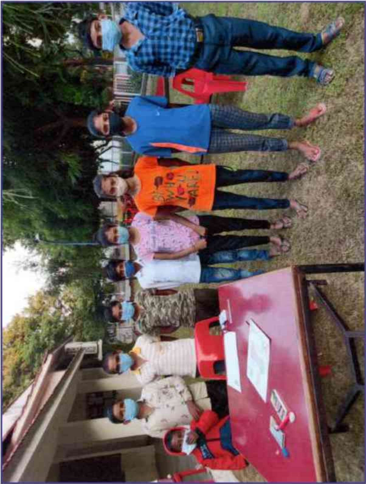
संस्थान द्वारा दिनांक 31 अक्टूबर, 2021 को आयोजित चित्रकारी प्रतियोगिता के प्रतिभागियों। Participants of the painting competition organized by the institute on 31 st October, 2021.