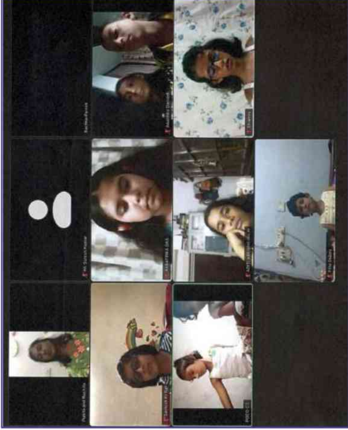
संस्थान में दिनांक 14 सितम्बर, 2021 को हिन्दी विक्स के अवसर पर ऑनलाइन माध्यम से बच्चों के कार्यक्रम का आयोजन। Online Children's Programme organised in the institute on 14 th September, 2021 on the occasion of Hindi Diwas.