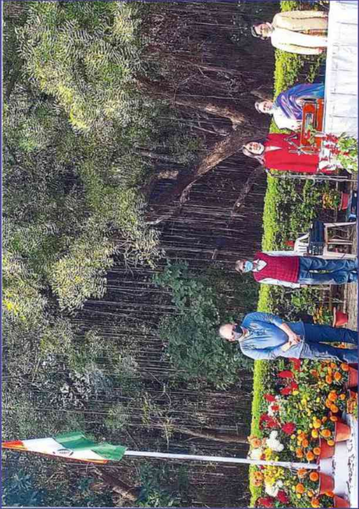
संस्थान में गणतंत्र दिवस 2022 के अवसर पर ध्वजारोहण कार्यक्रम का आयोजन। Flag hoisting programme in the institute on the occasion of Republic Day 2022.